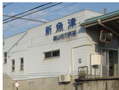
【富山地方鉄道 新魚津駅】

○ 試合前ルート ：【海の駅蜃気楼】⇒【ありそドーム】 11:00から 5～10分おき ⇒ 試合開始時間まで